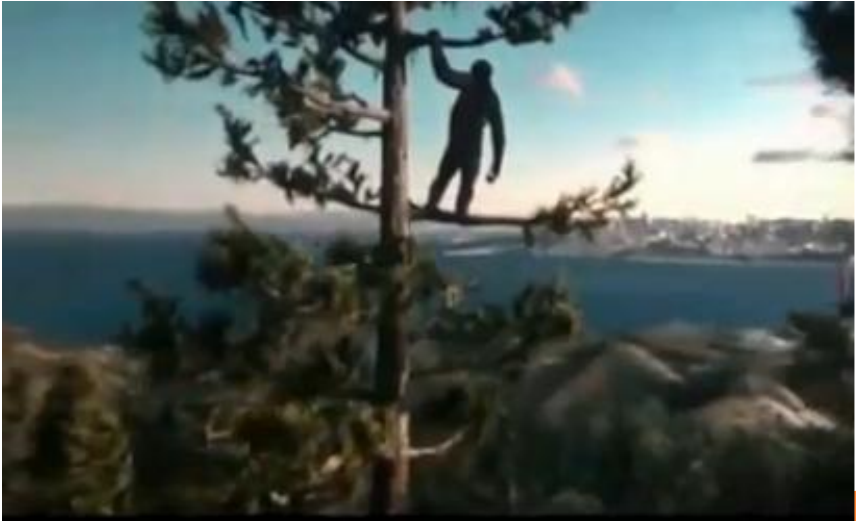
Planeta dos Macacos – A origem – cena final

PESSIMISMO NO IMAGINÁRIO ARTÍSTICO E CINEMATOGRAFICO