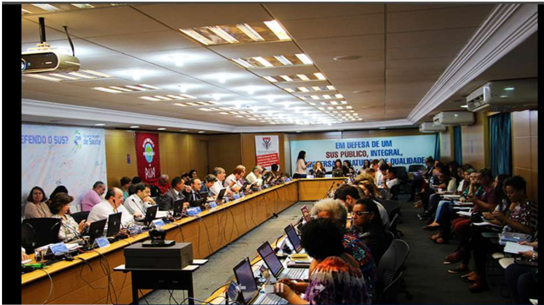
309ª reunião ordinária do Conselho Nacional de Saúde (CNS), Brasília, 12 set 2018